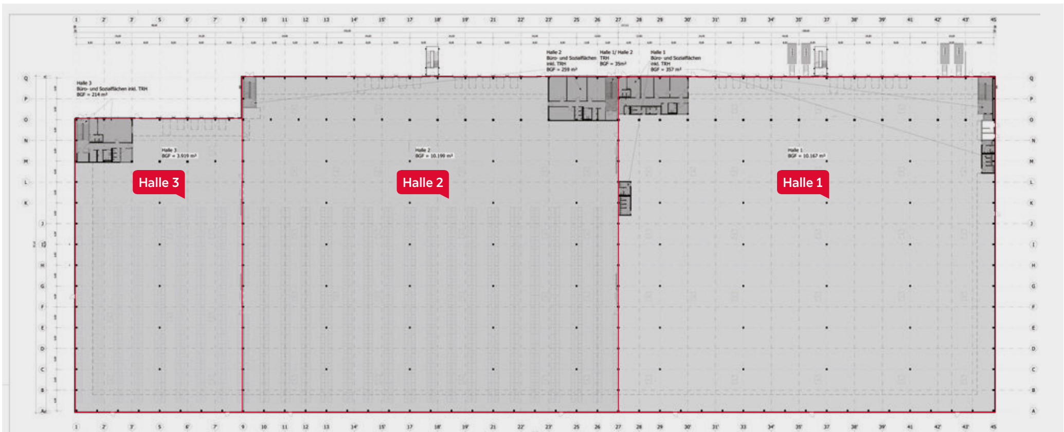
Grundriss Erdgeschoss Detailansicht