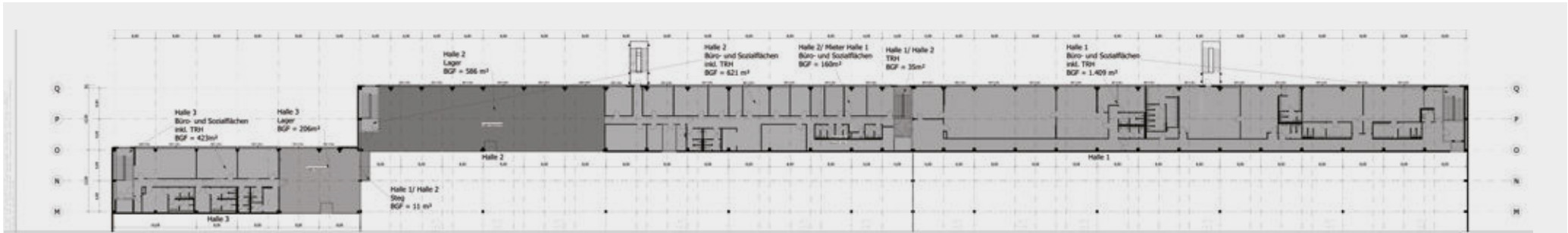
Grundriss Mezzanine Detailansicht